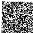
TÖRÖCSIK FERENC ügyvezető / kreatív igazgató