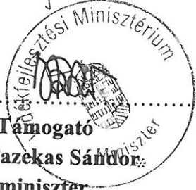
Támogató Dr. Fazekas Sándor miniszter

Kelt, Hódmezővásárhelyen, 2014. március 11.