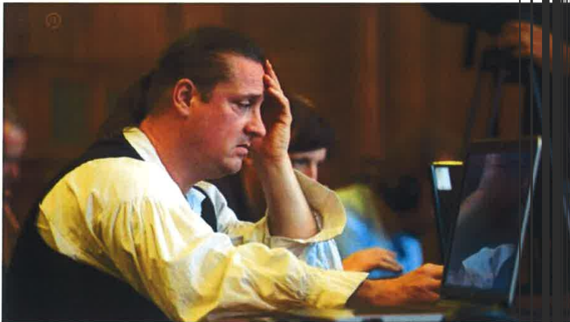
Tárgyalás- Az M7-es új 20 kilométeres szakaszának építésén