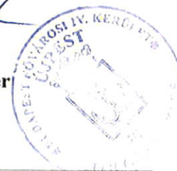
Déri Tibor Polgármester